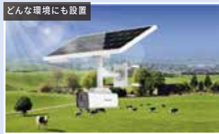
どんな環境にも設置